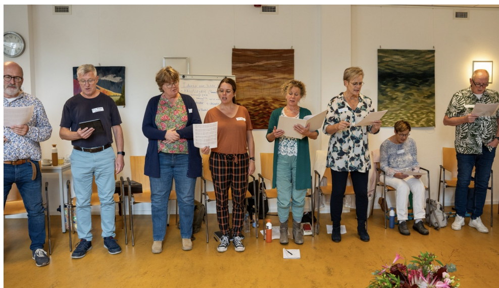
Koorleidersdag 7 oktober 2023