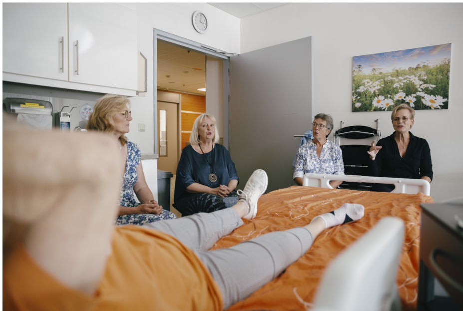
De Bedside Singers Leiden e.o.