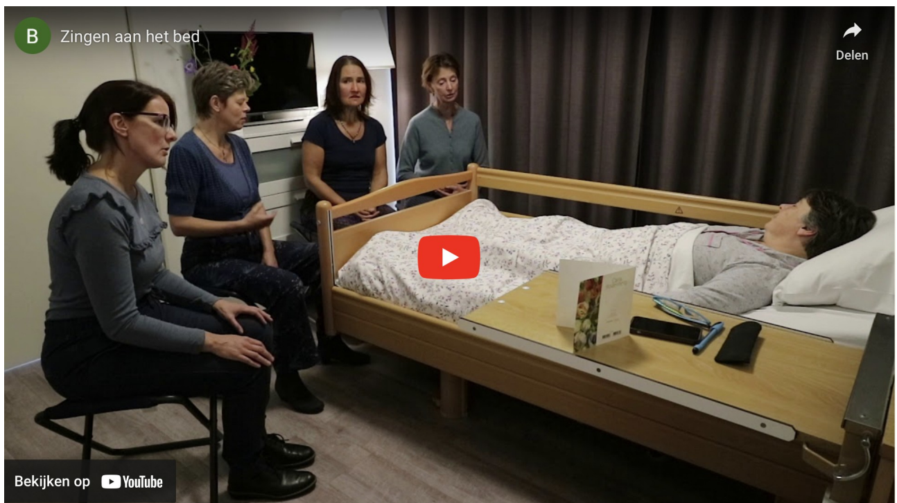
De Bedside Singers Amsterdam zingen Durme in Hospice ZorgHerberg Oostpoort