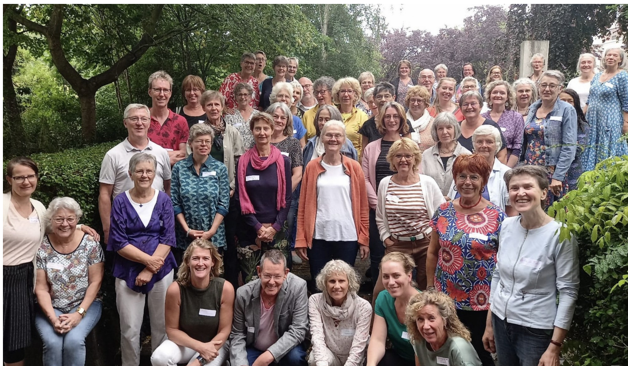
Landelijke Korendag 2023

Voor alle Bedside Singers organiseren we 1 keer per jaar de Landelijke Korendag, om ons te verbinden met elkaar, ervaringen uit te wisselen, van elkaar te leren en elkaar te inspireren. De Landelijke Korendag van 2023 vond plaats op 1 juli in Parnassos in Utrecht. Er waren 57 enthousiaste Bedside Singers aanwezig.